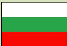
Bandeira da Bulgária