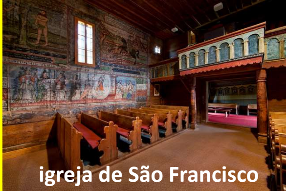
igreja de São Francisco