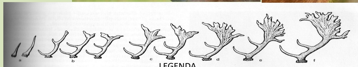
LEGENDA a)Primeira cabeça ou VARETO. b)Segunda/terceira cabeça c)Quarta/quinta cabeça d)Sexta cabeça e)8 - 9 anos f) 10 e mais anos.