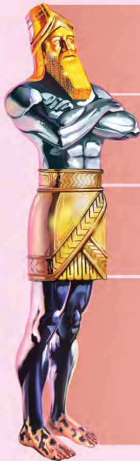
IMAGEN DE LA ESTATUA DE NABUCODONOSOR COMPARADA CON LOS CUATRO ANIMALES